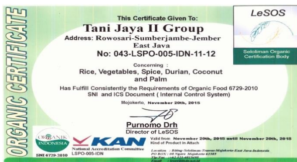
a) Sertifikat organik Kelompok Tani “Tani Jaya II”

Hasil yang dirasakan oleh kelompok tani “Tani Jaya II” setelah memperoleh perpanjangan sertifikasi yaitu masih adanya sertifikat dan logo organik dalam setiap produk (beras organik), sehingga dapat meningkatkan kepercayaan konsumen. Manfaat lainnya yaitu memudahkan dalam hal pemasaran, karena produsen percaya bahwa produk yang dihasilkan kelompok tani telah tersertifikasi organik. Kelompok tani juga memperoleh pembinaan dari pihak LeSOS, sehingga dapat konsisten dalam menerapkan usahatani padi organik. Output yang dicapai oleh kelompok tani “Tani Jaya II” berupa produk organik yang berhak memperoleh logo organik yang terdiri dari beras putih, beras merah, dan beras hitam.