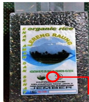
b) Produk dengan label organik